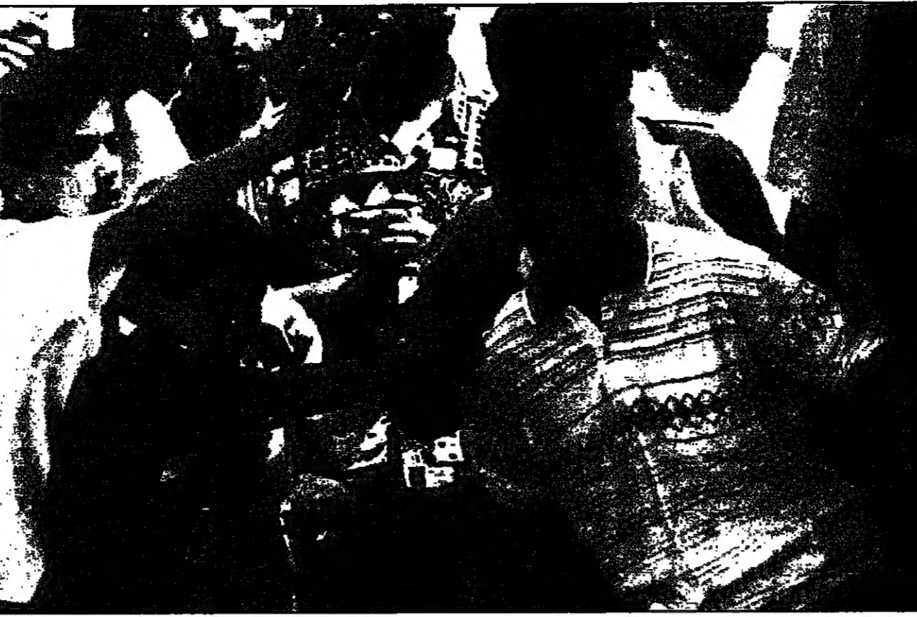
سبعة فلسطينيين يشتبهون قوات الاحتلال في الخليل بالمجازرة ومثل يصوب بحرم مسجداً، ليلة الأربعاء (يونيو)

الخليل - القدس - رويترز: قال شهود عيان ان الجنود الاسرائيليين اصابوا سبعة فلسطينيين على الاقل بطلقات ماطانية في اشتباكات بالخليل بالخليل الغربية الجمعة في تفجير جديد للعنف بالبلدية المقامة. وقال الشهود ان 50 شابا تقريبا شاركوا في الاضطرابات بلباء عفرات من قبائل الكيزيين وقبائل صوت مسجلة الصبح على الجنود الاسرائيليين بعد خط الشماس الذي يقسم الخليل الى منطقتين تخضع احدهما لاسرائيل والاخرى للسلطة الفلسطينية. وشاركوا في الجنود الاسرائيليين رماوا باطلاق الاغمورة المضطربة مما اسفر عن اصابة سبعة اشخاص على الاقل، وخلفت حدة الاشتباكات بالتحريج بعد الغضب.